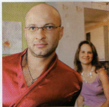
Tantra je indický kult stary až dva tisíce let. Svého vrchołu dosáhl v 11. a 12. století, kdy se stal „oslavou radosti světa a potěšením životem“.

a tantra masáž – schopnost láskyplně dávat nebo přijímat dotyk a pozornost druhého člověka. Znát to banálně, ale po této zkušenosti dokonce i na sobě pozorují, jak povrchně jsem občas dokázal k sexu i vlastní sexualitě dosud přistupovat a jakých hloubek protřívání lze přitom dosáhnout.